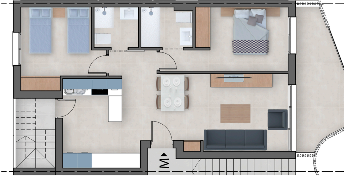
Planta Primera / First Floor